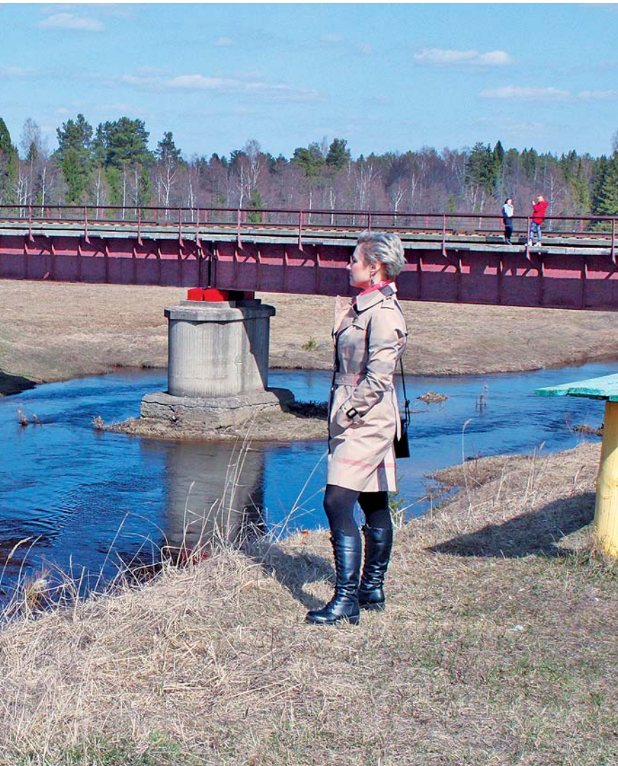
ная набережная, и, надо сказать, что именно её тут и не хватает. Отличное