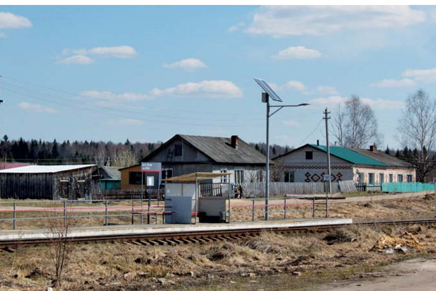
панция в п. Северный оборудована солнечными батареями, от которых рабо- рмы. Современные технологии уверенно идут в глубинку нашего района!