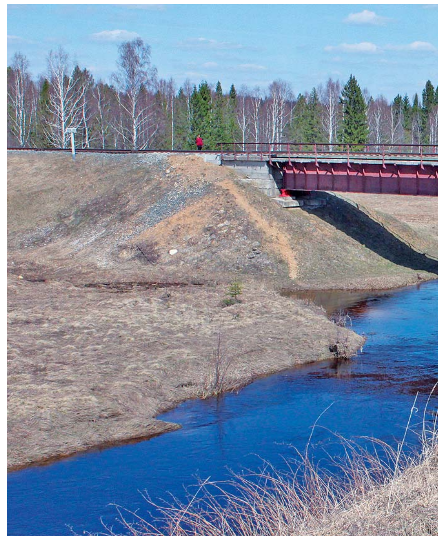
Мы побывали на том месте, где в скором времени появится благоустроенное место для культурного досуга северян!

Варнавинской глубинке жизнь продолжается. Жаль, что безвозвратно уходят представители старшего поколения – очевидцы войны. На территории Северного сельсовета сегодня проживают три вдовы участников Великой Отечественной войны, семь тружеников тыла. Каждый год их поздравляют и чествуют. Этот год – не исключение. Предстоит шествие «Бессмертного полка» и традиционный митинг у памятника воинам.